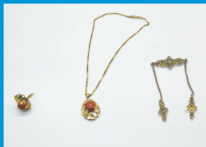
インドネシア出身の入所者が祖母から形見にもらったサンゴの指輪と金のアクセサリ

※各イベントの申し込み方法につきましては、ホームページやSNSでお知らせします。 ※本チラシで公開した情報は、予告なく変更する場合があります。ご了承ください。