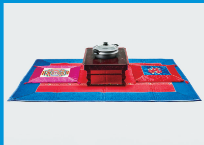
多磨全生園の在日朝鮮人入所者のお茶の間(1980年代以降)