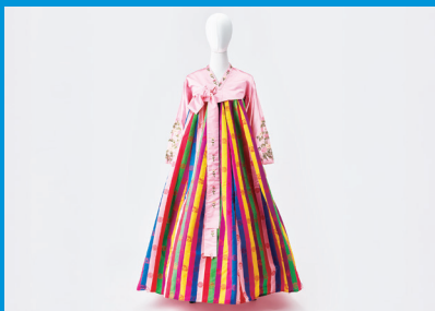
多磨全生園の民族舞踊グループ「アリランの会」で使用されたチマチョゴリ(1990年代以降)