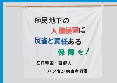
日本の植民地であった療養所入所者が日本政府を訴えた裁判支援の横断幕。在日韓国・朝鮮人ハンセン病患者同盟(2005年)