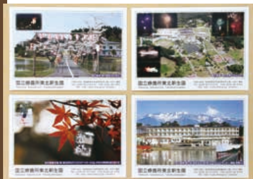
啓発用のポストカード