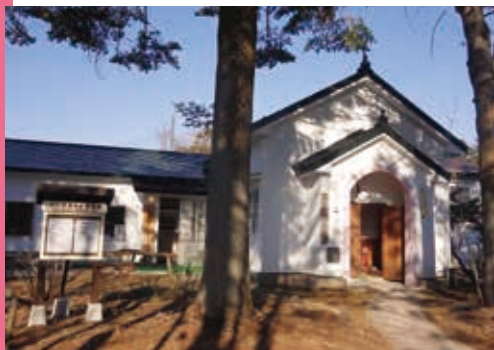
草津聖バルナバ教会