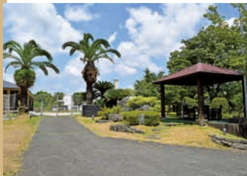
待労院創立百周年に造園された前庭