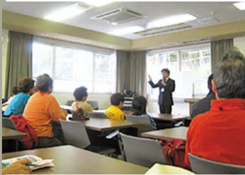
学芸員による講演