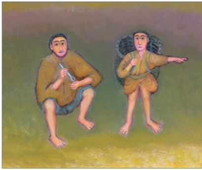
大山清長「島の人(しまんちゅ)」(1998年、油彩)