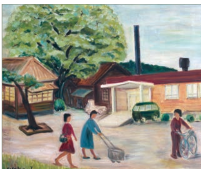
入江章子「園内風景」(1998年、油彩)