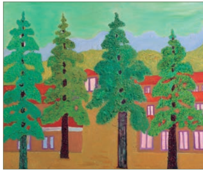
森繁美「園内風景」(1999年、油彩)