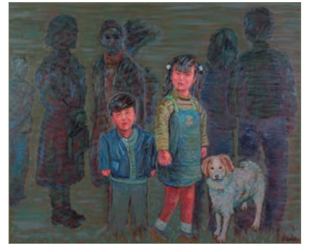
矢野悟「きょうだい」(制作年不明、油彩)