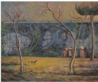
吉山安彦「陽だまり」(1991年、油彩)