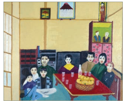
木下今朝義「家族」(制作年不明、油彩)