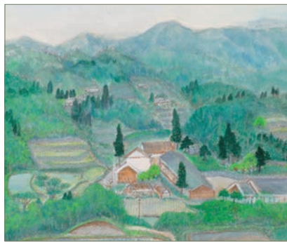
堀崎一雄「風景I」(1987年、水彩)