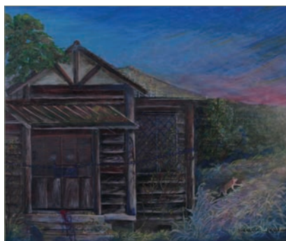
中原繁敏「鎖」(2000年、油彩)